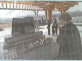
遺構施設で慰霊碑に花をたむけ、手を合わせる女性=11日、岩手県陸前高田市。

東日本大震災から、11日 で11年をむかえました。 全国で死者(関連死をふくむ)・行方不明者は 2万2200人以上。関連死は 今も増え、避難している人は 全国で3万人をこえています。