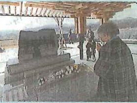
追悼施設で慰霊碑に花をたむけ、手を合わせる女性—11日、岩手県鹿角市高田町。

東日本大震災から、11日目で11年をむかえました。全国各地で死者(関連死をふくむ)・行方不明者は2万2200人以上。関連死は今も増え、避難している人は全国で3万人をこえています。