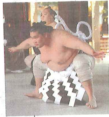
明治神宮で春納土俵入りをする横綱照ノ富士=2月1日、東京都渋谷区