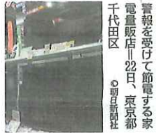
千代田区 電量販店=22日、東京都

東京電力管内の電力の厳しくなるとして「電」を初めて出しました。企業の協力を呼びかけ、電力の節電を求めました。22にも同様の警報を出し、東京を震源とする地震でが止まった影響などから