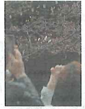
靖国神社のソメイヨシノ=20日、東京都千代田区

東京管区気象台は20日、東京部心の桜が開花したと発表しました。靖国神社(千代田区)にあるソメイヨシノの標本木で気象台の職員が10輪咲いているのを目で確認しました。去年より6日遅く、平年より4日早いといわれます。夏にできた花の芽が一度休眠し、冬の寒さで自覚める「休眠打破」という現象が順調に進んだのが早咲きの理由とみられます。