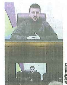
オンラインで演説をするゼレンスキー大統領=23日、東京都千代田区