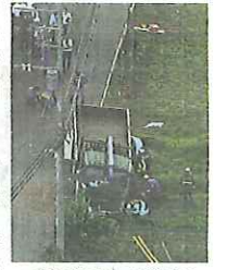
事故の現場=2021年6月28日、千葉県八街市

千葉県八街市で去年6月、小学生の列に飲酒運転のトラックがつかみ、子ども5人が死傷した事故で、罪に問われた元運転手に対して、千葉地方裁判所は25日、懲役14年の判決を言いわたしました。裁判長は「被告の運転にのぞむ態度は最悪のもので、強い非難に値する」としました。判決によると、被告は運転中にアルコールの影響で目眩りし、下校中の子ども5人をはねました。当時8歳と7歳の子ども2人が亡くなりました。