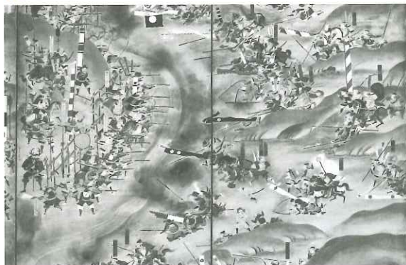
左側が織田信長と徳川氏の連合軍、右側が武田軍。織田信長は、鉄砲や櫓・堀などを有効に使って戦った。