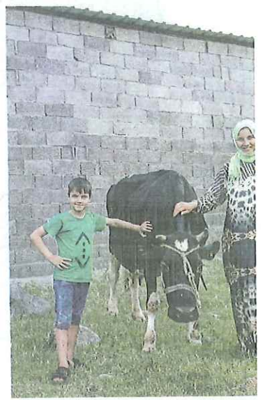
トルコ南部にくらす、シリア難民の親子

こまつ・ゆか 1982年、秋田県生まれ。ドキュメンタリーフォトグラファー。2006年、エベレストに次ぐ高峰K2(標高8611メートル)に、日本人女性として初めて登頂。植村直己冒険賞受賞。その後、ユーラシア大陸の草原や砂漠を旅し、写真家の道へ。12年からシリア内戦・難民をテーマに撮影。著書に「人間の土地へ」(集英社インターナショナル) など。