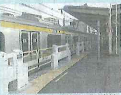
設置されているホームドア=千葉県船橋市のJR下総中山駅

JR東日本は5日、山手線や中央線など首都圏の主な路線の普通運賃を、2023年春から10円上げると発表しました。お年寄りや障がいのある人も使いやすい、バリアフリーの設備を整えるためです。