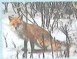
北海道・知床国立公園内のキタキツネ

北海道は4日、札幌市内で死んで見つかったキタキツネ1匹から、感染力の強い「高病原性鳥インフルエンザウイルス(H5亜型)」が見つかったと発表しました。環境省によると、ほ乳類の鳥インフルエンザ感染が確認されたのは国内で初めてだといえます。