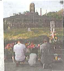
⑦ 魂塚の塔 (糸満市) 1946年2月、沖繩で最初に建てられた慰霊塔。生き残った村民たちが南部に散らばる遺骨を拾い集めて納めました