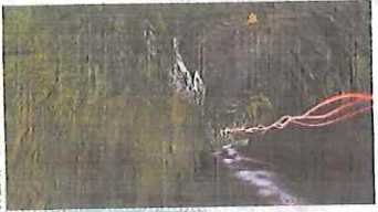
④ 沖繩陸軍病院南風原壕群20号 (南風原町) 沖繩戦当時、病院として使われた壕。負傷したり病気になるたりした兵士が運びこまれ、女子学生で構成された「ひめゆり学徒隊」が看護しました