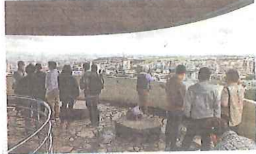
② 嘉数高台公園 (宜野湾市) 激戦地の一つ。日本軍が攻撃の拠点として立てこもり発砲した「トーチカ」跡があります

① アハシヤガマ (伊江島) 米軍の上陸後、約20世帯の住民が避難していたガマ(自然洞穴)。捕虜になることを恐れた住民約150人が自ら命を絶つ「集団自決」が起こりました