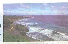
⑧ 喜屋武岬・荒崎海岸 沖繩戦最後の激戦地といわれます。追いつめられた多くの住民や軍人が命を落としました