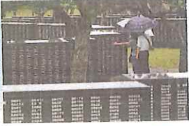
⑥ 平和の礎 (糸満市) 平和を願い、国籍や軍人、民間人の区別なく、沖繩戦などで亡くなった人々の名前を刻んだ慰霊碑。平和祈念公園内には沖繩県平和祈念資料館もあります