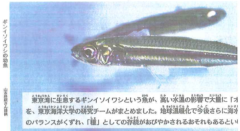
ギンイソイワシの幼魚

感想は、メール (asasho@asagaku.co.jp) か郵便 (〒104・8433朝日小学生新聞) で、「ジャンケンポン」係まで。名前、〒住所、電話番号、学年を忘れずに。