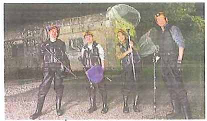
千葉県館山市

生育環境で性別が変わる魚たち 魚の中には、生まれたあとの環境条件によって、性別が変わりやすい種類が多く知られています。 たとえば、暖かい海でイソギンチャクと共生するクマノミの仲間は、群れの中でいちばん体が大きい個体がメス、