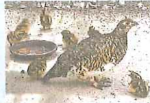
ふ化した次の日に歩き出したライチョウのヒナたち

長野県の中央アルプス(木曾山脈)で絶滅したとされてきた、国の特別天然記念物・ライチョウ。敵のいない動物園で繁殖させたライチョウを野生にもどす「復活作戦」で、那須どうぶつ王国(栃木県)が5日、ヒナ8羽がふ化したと発表しました。2018年から始まった活動で、ヒナの誕生は今回が初めてです。