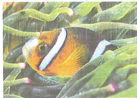
クマノミ

東京湾に生息するギンイソイワシという魚が、高い水温の影響で大量に「オス」を、東京海洋大学の研究チームがまとめました。地球温暖化で今後さらに海水のバランスがくずれ、「種」としての存続がおびやかされるおそれもあるとい